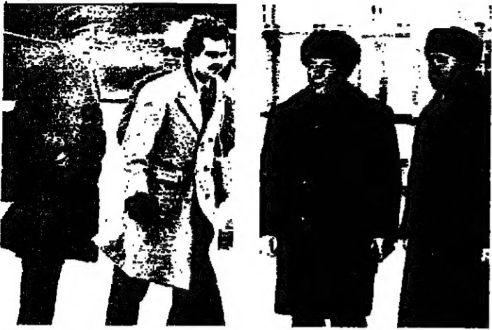
شولتز لحظة وصوله إلى سويسرا، وسط موجة الصقيح التي شربت معظم الدول الاروبية